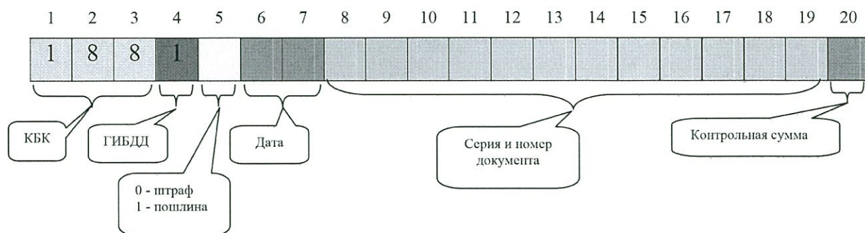
Рис.1. Схематичное представление идентификатора начисления

Идентификатор начисления (УИН) – уникальный двадцатисимвольный ключ. Все позиции в ключе должны быть заполнены. Для заполнения ключа могут использоваться цифры от 0 до 9 и прописные латинские и русские буквы.